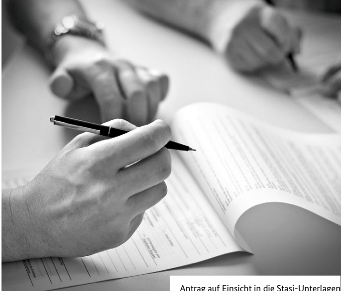
Antrag auf Einsicht in die Stasi-Unterlagen